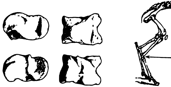
Fig. 3 Astragale. Jeder der vier Astragale zeigt eine andere Seitenfläche. Rechts die Hinterbeine eines Schafes. Der Pfeil bezeichnet die Lage des Astragalos (αστράγαλος, talus, Sprungbein) in der Fusswurzel. [14]

Beim Spiel mit den vier Astragalen galt der Venuswurf ( iactus Venerius , Aphrodite-Wurf ) als bester Wurf: Jeder Astragalos zeigte dann eine andere Seite; der schlechteste Wurf war der Hunde-Wurf ( canis ; kyon ): vielleicht ein Wurf mit viermal der Seite 1. Es sind 35 Seitenkombinationen möglich: 35 Kombinationen mit Wiederholung der Länge vier aus vier Elementen (aus den vier Seitenflächen). Es sind nur wenige Namen solcher Seitenkombinationen überliefert; noch weniger weiss man über die Werte der einzelnen Seitenkombinationen. Man kann aber immerhin feststellen, dass man nicht einfach die oben erwähnten Zahlenwerte addiert hat. Die Bewertung der einzelnen Kombinationen muss kompliziert gewesen sein: Ovid berichtet von Autoren, die Bücher zum Thema quid valeant tali – was die Knöchel gelten sollen – geschrieben haben.