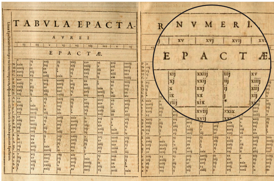
Figur 3: Tabelle zur Bestimmung der Gregorianischen Epakte aus der „Explicatio“ [Cla03, S. 110/111] unter Berücksichtigung der Sonnen- und Mondgleichungen. Die Zuordnung zwischen den Buchstaben in der ersten Spalte und den Jahrhunderten ist in weiteren Tabellen (Tabula Aequationis [Cla03, S. 112ff]) festgelegt.